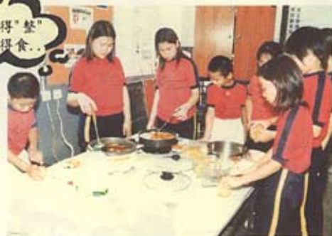
無論男女，也有煮食的天份。