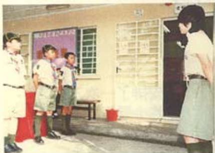
看！童軍們為學校服務！