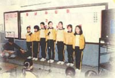
聖誕聯歡會卡拉OK大賽

於二零零一年，我校派出五位六年級同學參加由匯知教育機構與伯裘女子中學合辦之第一屆全港小學英語民歌組合歌唱比賽，並取得優異表現狀。