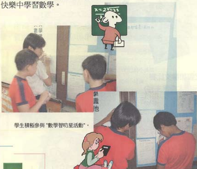
學生積極參與「數學智叻星活動」。

本年數學科學辦了各項活動，藉以提高學生學習數學的興趣及邏輯的思維能力。爲了擴闊學生的眼界，本校於本年度參加了兩項元朗區數學比賽—妙法寺陳呂重德紀念中學主辦「元朗區小學校際數學競賽2002」及第二屆「伯裘杯」數學比賽，同學們都投入參與。此外，每週的課外活動，均設有趣味數學班，讓學生透過活動，學習一些解難及邏輯運算的技巧，從快樂中學習數學。