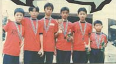
21名學生參加全港簡易運動比賽