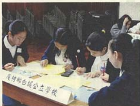
大家全神貫注地 進行數學比賽。