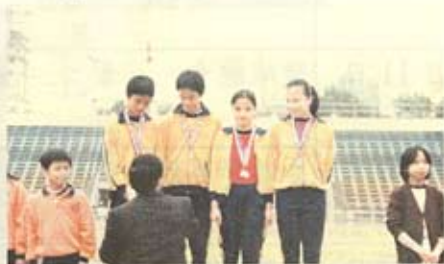
我們的接力隊在接受冠軍獎杯。