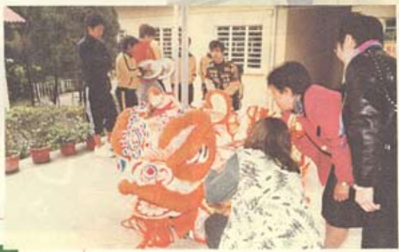
校長、嘉賓為醒獅點睛。