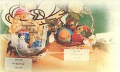
美勞科比賽 (復活蛋設計比賽)