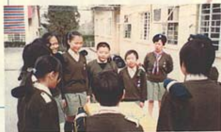
香港童軍總會第一二六〇旅 幼團軍團成立典禮

爲了促進學生德、智、體、群、美五育的發展，本校於二零零一年十二月九日，正式成立一隊幼童軍團。透過進行多元化的活動、進度性專章的考核，爲學生們提供童軍知識、生活技能及團隊規律等訓練，從而培養他們成爲一個獨立、有自信、樂於助人及勇於承擔的人。