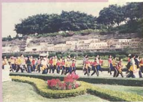
一行人浩浩蕩蕩走過中國的名山大川！

爲了讓學生「走出課室」，並增加同學對中國文化的認識，本校師生及家長於本學年10月30日首次走出香港，到深圳錦繡中華及民俗文化村參觀。