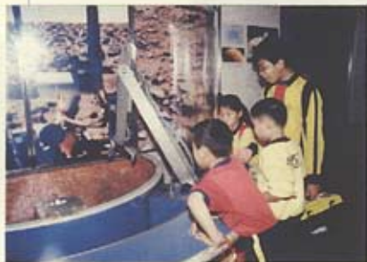
太空館內的遊戲 很有趣呢！

除了專題研習外，本校更為同學安排了不同的參觀活動，本學年度已分別參觀了太空館、科學館、海防博物館，透過不同形式的參觀活動，使學生對常識科內容有更透徹的了解。