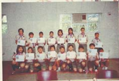
經過重重考驗，我們終於取得幼童軍獎章！