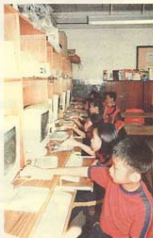
電腦應用樂趣多，網上新知樂無窮。

本校一向關注學童的身心發展，除了增強學生在認知方面的吸收外，更注重青少年的德、智、體、群、美各方面的發展。今年校方舉辦了多項校內及校外活動，希望他們能在課餘活動上，發展多元智能，提昇自信，發揮創意，更藉群體生活學習與人溝通技巧，培養領袖才能，使他們成為社會的未來棟樑。