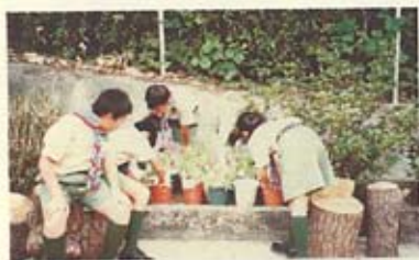
我們的蕃茄一天一天的長大了！