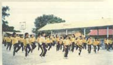
在學校開開心心做早操。