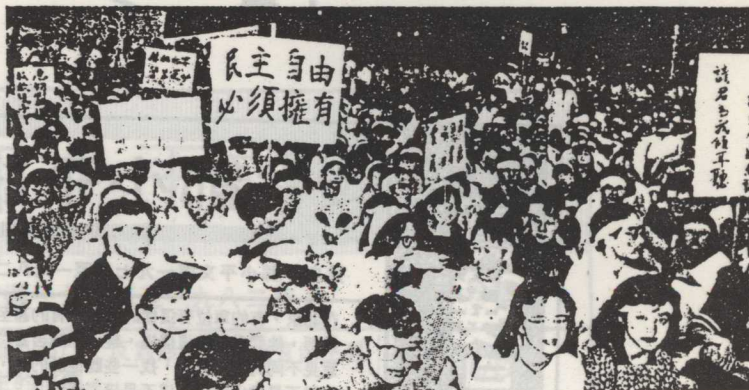
香港專上學院學生在維多利亞公園集會聲援北京學生行動

二、要達到團結人們的目的，最迫切的是要嚴懲貪官污吏，減少幹部及其子女的特權，使社會有相當程度的公平性。