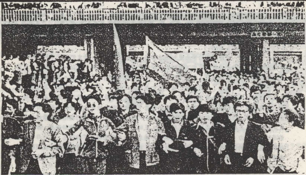
北京大學學生街頭示威

府更是精細，只講「向錢看」，政治則碰不得，「四個堅持」不能談」。八五、八六年輿論較「寬鬆」，他就來一場「反資產階級自由化」，才幾棍就把剛冒頭的知識分子打下去了。