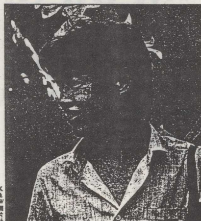
吾爾開希：「破」的工作已完成

理論不足是今次學運的最大缺陷。學運進入校內民主建設的階段後，應從理論層面上確立學生組織的民主性和合法性，發展校內民主生活，包括辦報、廣播和舉辦自由論壇。