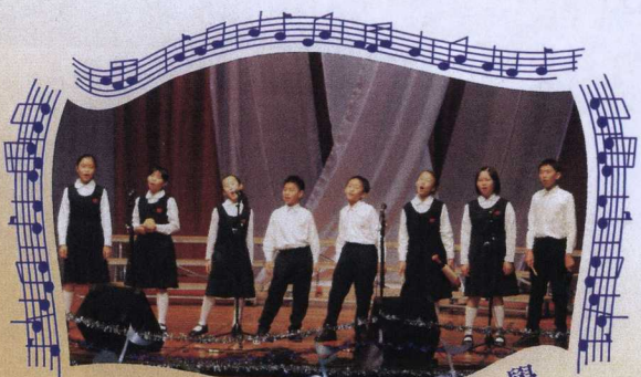
元朗公立中學校友會小學