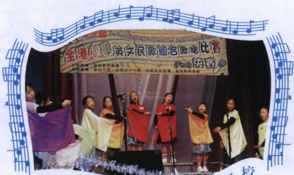
德望學校 (小學部) 下午校