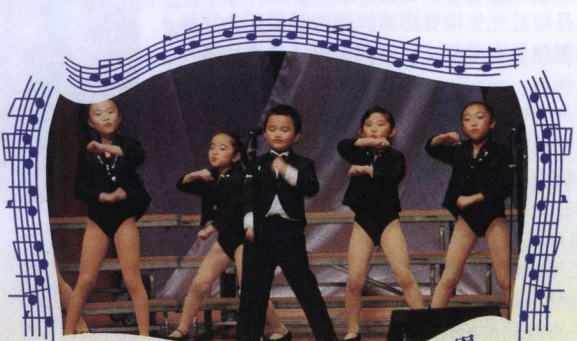
仁愛堂田家炳小學