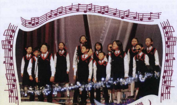
馬頭涌官立小學 (紅磡灣)