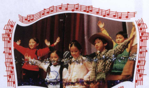
聖若翰天主教小學