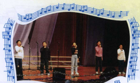
聖公會聖約翰小學