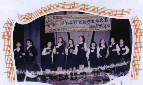
北角循道學校 (上午校)