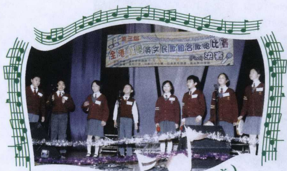
佛教中華康山學校 (上午校)