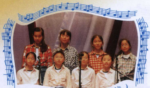
聖公會蒙恩小學 (上午校)