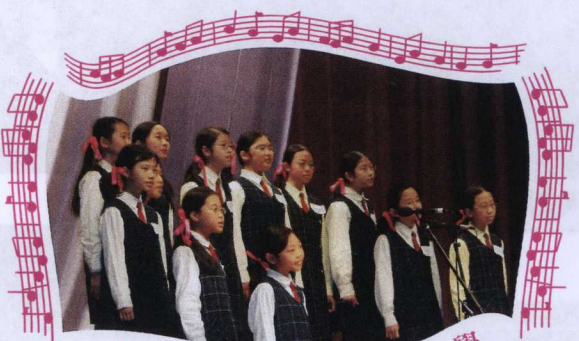
天水圍天主教小學