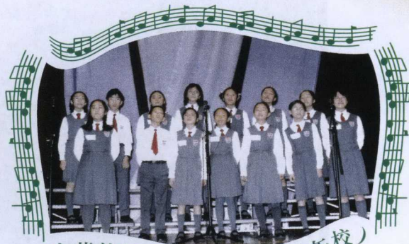
中華基督教會基法小學 (上午校)