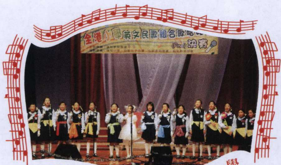
聖愛德華天主教小學